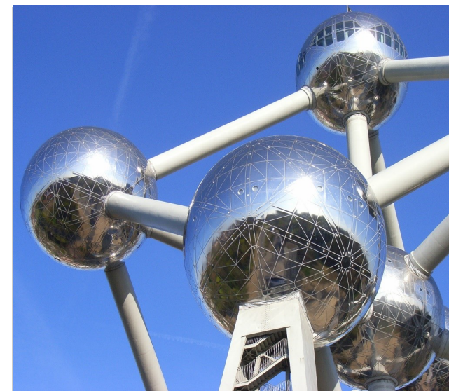
Brüssel: Atomium

02.03.- 03.03.2020 Prog.-Nr.: 2-20-152-p